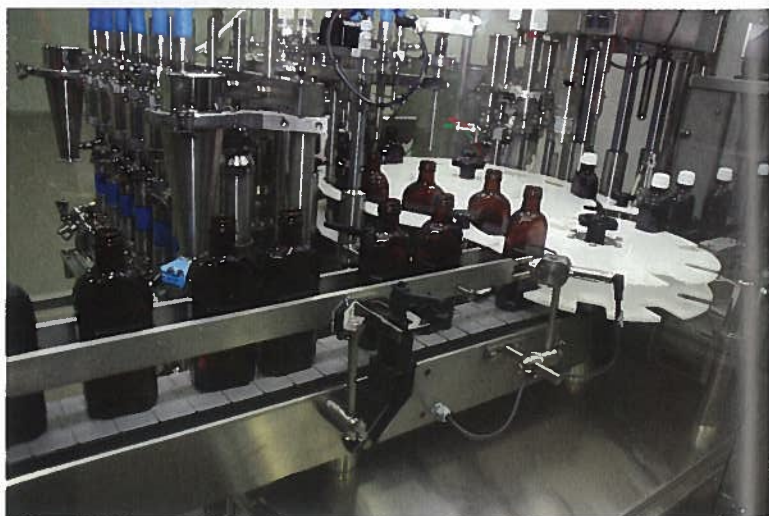
Głównym celem firmy jest bycie znaczącym partnerem na polu kontraktowych usług produkcyjnych